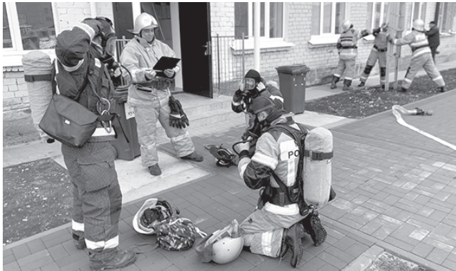
Пожарные готовятся к учениям

Огнеборцы Хабезского пожарно-спасательного гарнизона провели учения на базе гимназии им. И. А. Амирокова аула Кош-Хабль. Главная цель проведения учений — тренировка личного состава пожарно-спасательного подразделения по тушению пожаров в общеобразовательных учреждениях, управление силами и средствами на пожаре, взаимодействие с экстренными службами, проведение быстрого и четкого боевого развертывания.