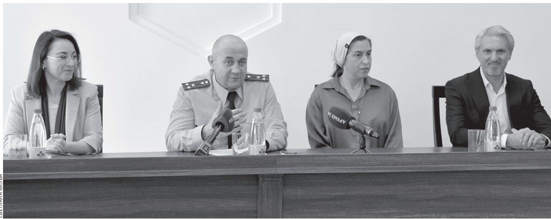
На круглом столе в прокуратуре республики обсуждали важную тему

Завершено строительство многофункциональной спортивной площадки в одном из населенных пунктов района. Планируется строительство новых объектов для активного отдыха молодежи.