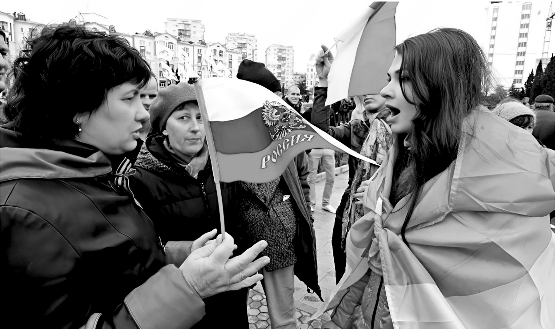
Война разделила даже самых близких людей